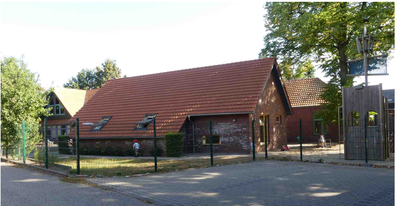
Außenansicht der Kita heute

2014 übertrug die Kirchengemeinde der gemeinnützigen Trägergesellschaft Horizonte die Kita. Die Horizonte erweiterte die Kita im Jahr 2019 um 110qm auf ihre heutige Größe und renovierte die bestehenden Räumlichkeiten. Seitdem können dort 106 Kindern spielen, toben und lernen.