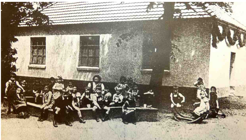
Die Kinder haben endlich ihren Kindergarten

Anfang März 1945: die Alliierten besetzen den Niederrhein, Süchteln steht unter dem Kommando des britischen Feldmarschalls Bernhard L. Montgomery. Der Krieg ist noch nicht zu Ende, es herrscht Zerstörung, Chaos und Elend. Die Lage ist unübersichtlich und gefährlich, alles ist provisorisch. Es geht darum, zu überleben und das in Trümmern liegende Land wieder aufzubauen. Vor allem die Frauen tragen die Verantwortung, da viele Männer gefallen oder noch in Kriegsgefangenschaft sind.